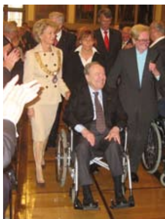
Große Gefühle im Kaisersaal ... 78

Titelfoto: Jack Goldstein, The Jump, 1978, 16mm, Farbe, stumm, 13 sec. (Filmstill), Courtesy Galerie Daniel Buchholz, Köln/Berlin und The Estate of Jack Goldstein