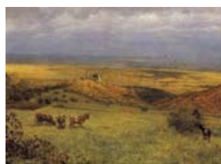
Hans Thoma – Ein Schwarzwaldmaler im Taunus 38