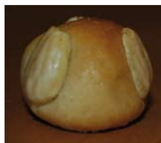
Von Lebkuchen, Brenten und Bethmännchen 50