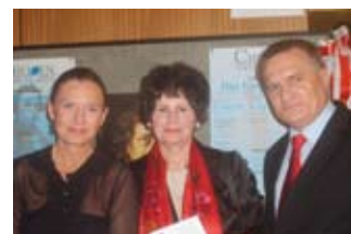
60 Jahre Gesellschaft der Musikfreunde in Bad Soden 28