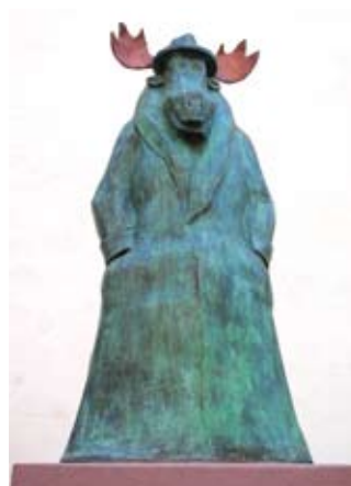
Denk mal am Denkmal! 18