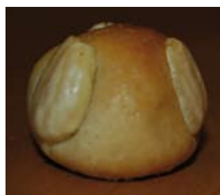
Von Lebkuchen, Brenten und Bethmännchen 50