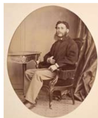
Von Lebkuchen, Brenten und Bethmännchen 50 Der Zeitungsmacher Leopold Sonnemann 48