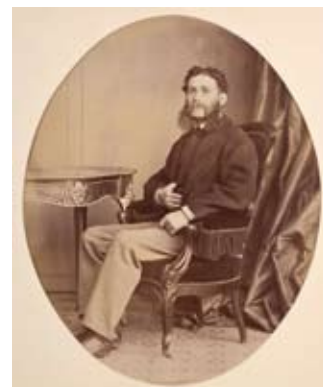
Von Lebkuchen, Brenten und Bethmännchen 50 Der Zeitungsmacher Leopold Sonnemann 48