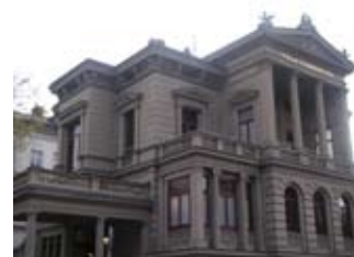
Literaturhaus Villa Clementine in Wiesbaden 34